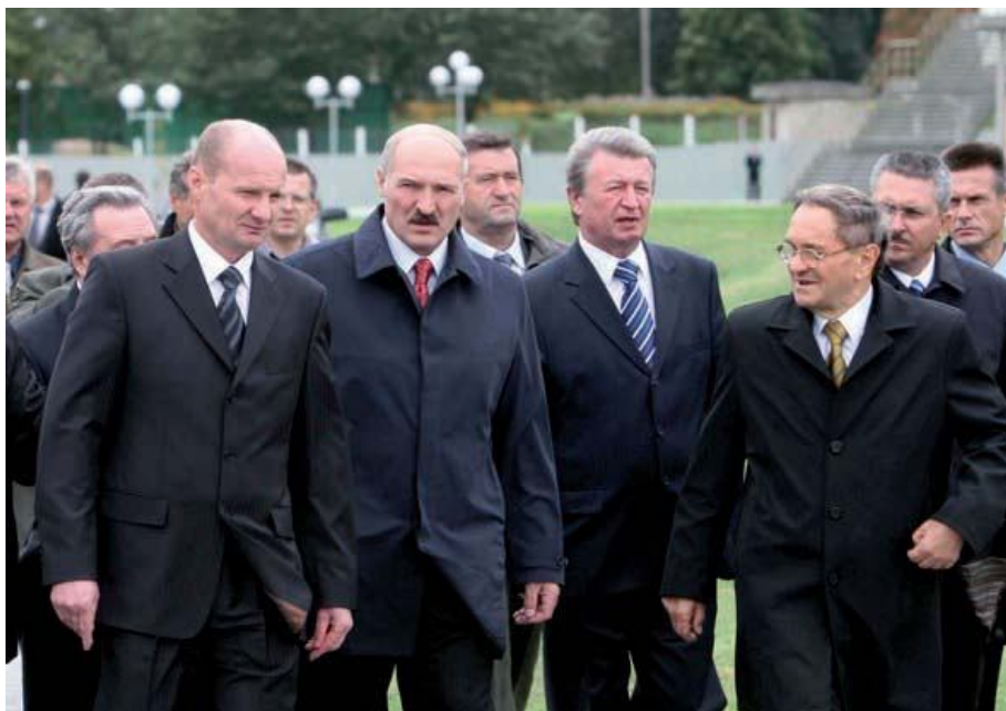
Посещение Полесского государственного университета Президентом Республики Беларусь А. Г. Лукашенко