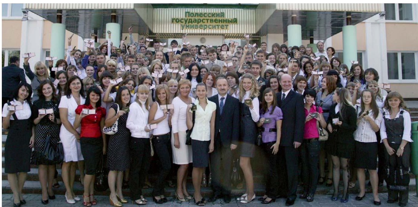
День знаний в университете

Пять лет назад, открывая высшее учебное заведение в Пинске, Президент Республики Беларусь А. Г. Лукашенко подчеркнул, что Полесский регион имеет мощный потенциал, который в кратчайшие сроки необходимо максимально задействовать для повышения эффективности народно-хозяйствен-