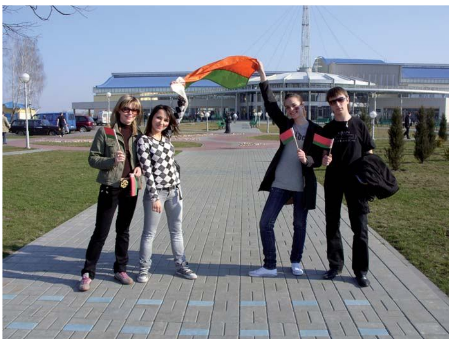
За сильную и процветающую Беларусь

Созданный на базе Пинского филиала Белорусского государственного экономического университета экономический факультет