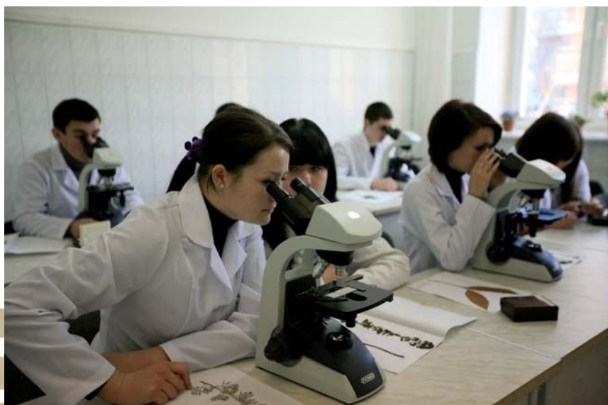
В лаборатории биотехнологического факультета

Сегодня факультет осуществляет подготовку студентов дневной и заочной форм обучения с полным и сокращенным сроками обучения по следующим специальностям и специализациям: