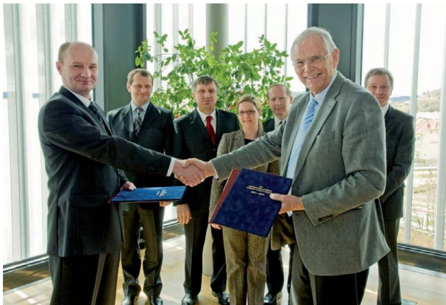
Подписание соглашения о сотрудничестве между Полесским государственным университетом и Университетом прикладных наук в г. Кремс (Австрия)

ного комплекса. Роль Полесского государственного университета для данного региона должна стать определяющей. Перед созданным учебным заведением были поставлены следующие стратегические задачи: обеспечить национальную финансовую систему высокопрофессиональными кадрами и научную составляющую для вывода белорусского Полесья на новый, более высокий уровень социально-экономического развития.