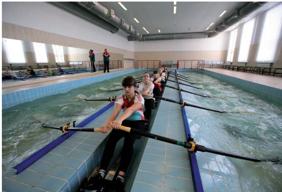
Занятия по физической культуре на гребной базе ПГУ