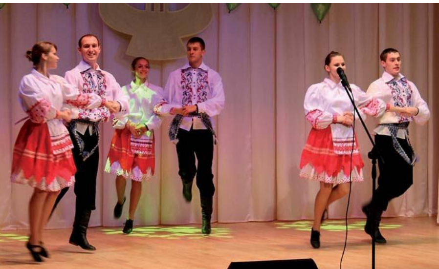
Народный ансамбль эстрадного танца «Альянс»

осуществляет подготовку студентов по следующим специальностям и специализациям: