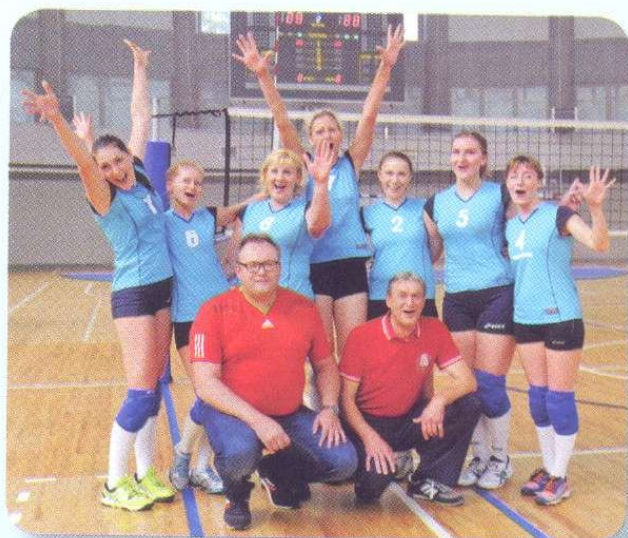
Победитель в турнире по волейболу – команда Витебской области