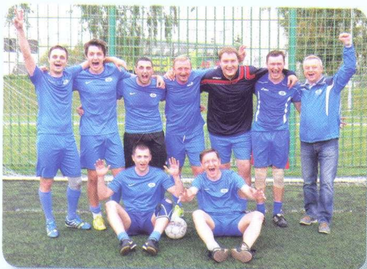
Победитель в турнире по мини-футболу – команда Белэксимгаранта