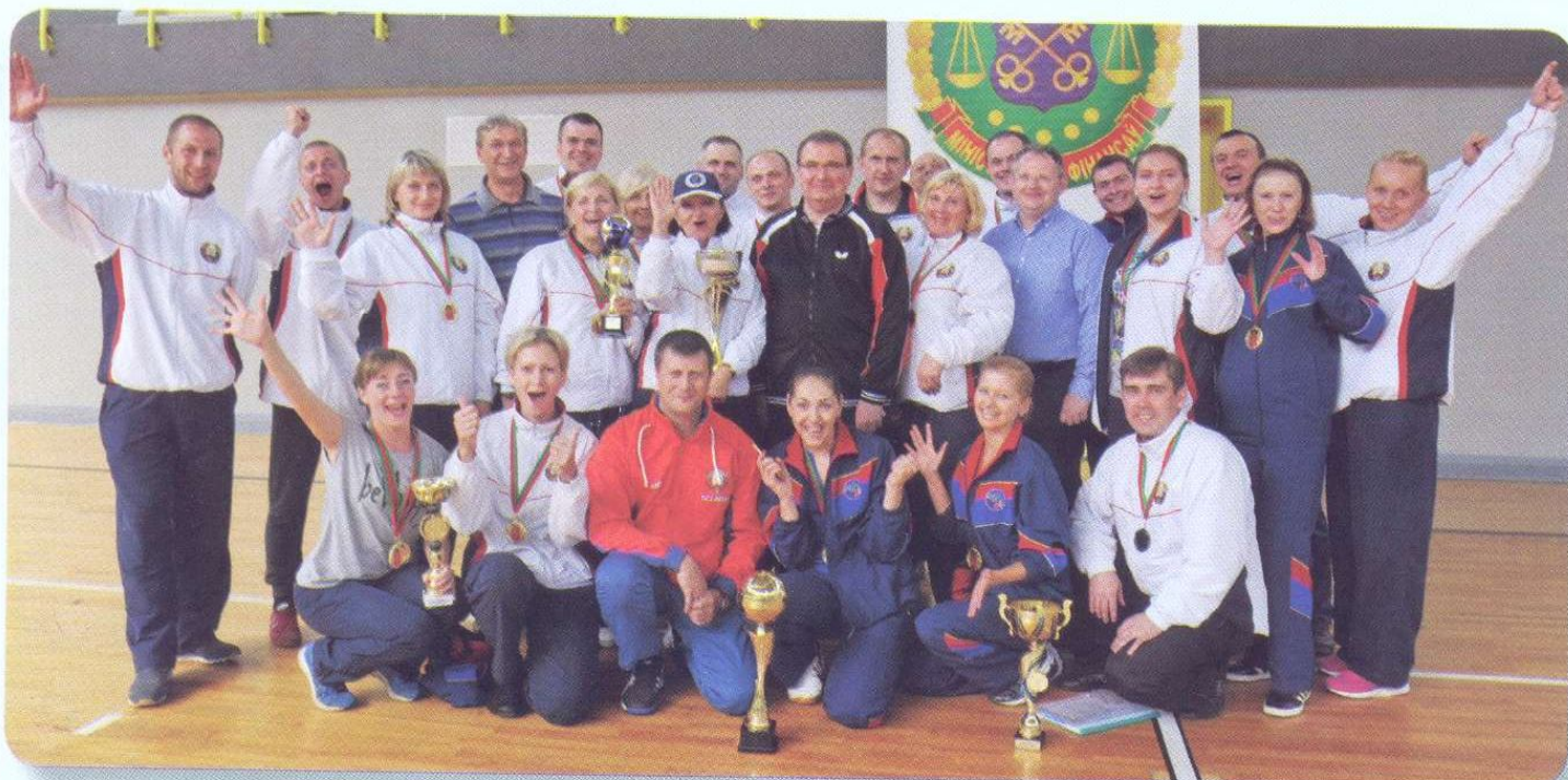
Победитель спартакиады – команда Витебской области