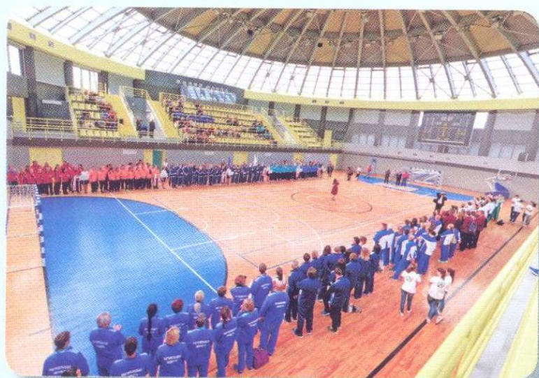
Во время церемонии открытия спартакиады