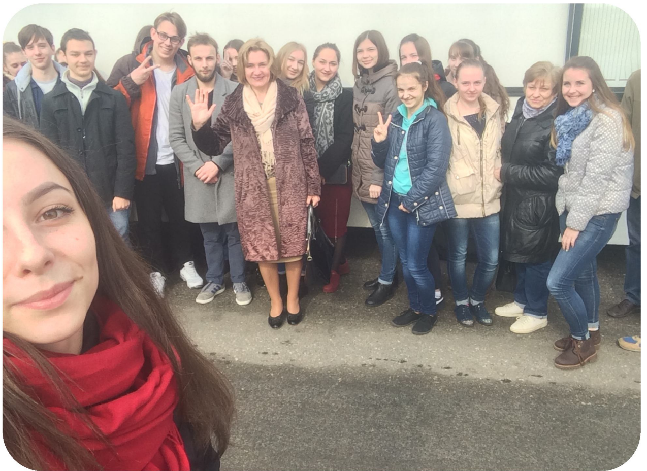
Со студентами ПолесГУ на предприятии КУПП «Маньковичи»