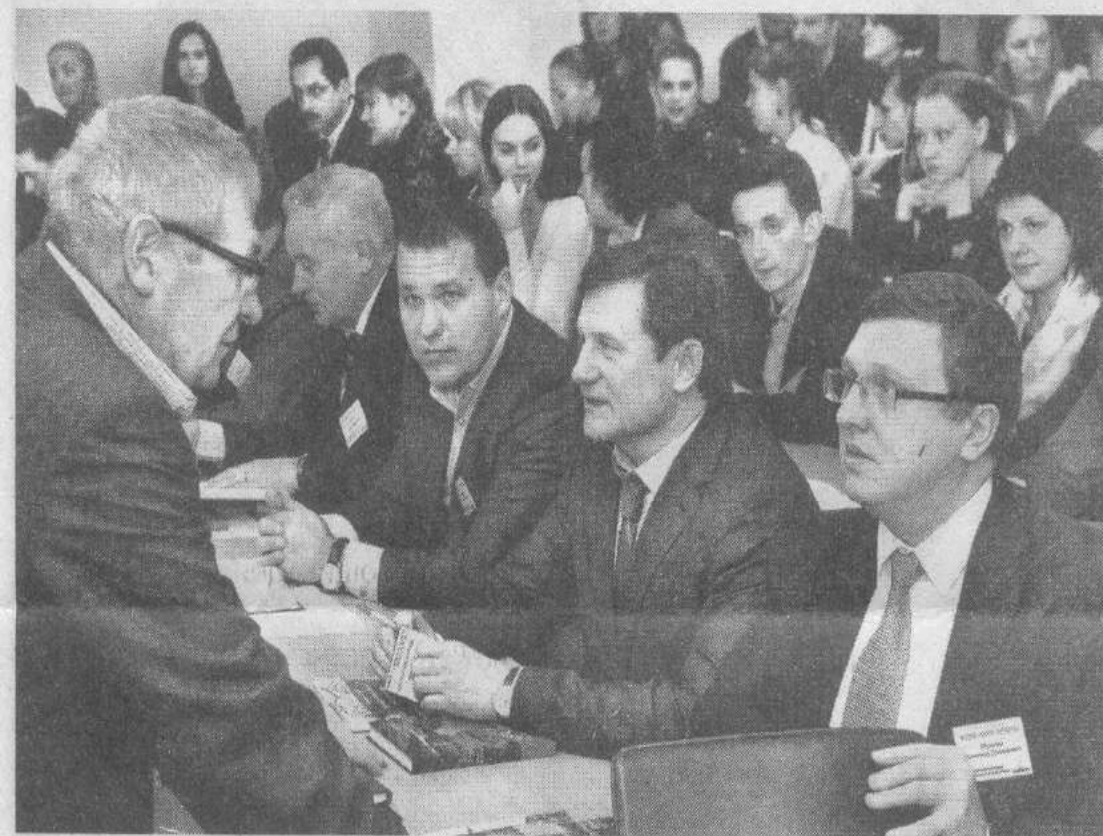
Обсуждение проектов экспертным советом и в студенческой аудитории.