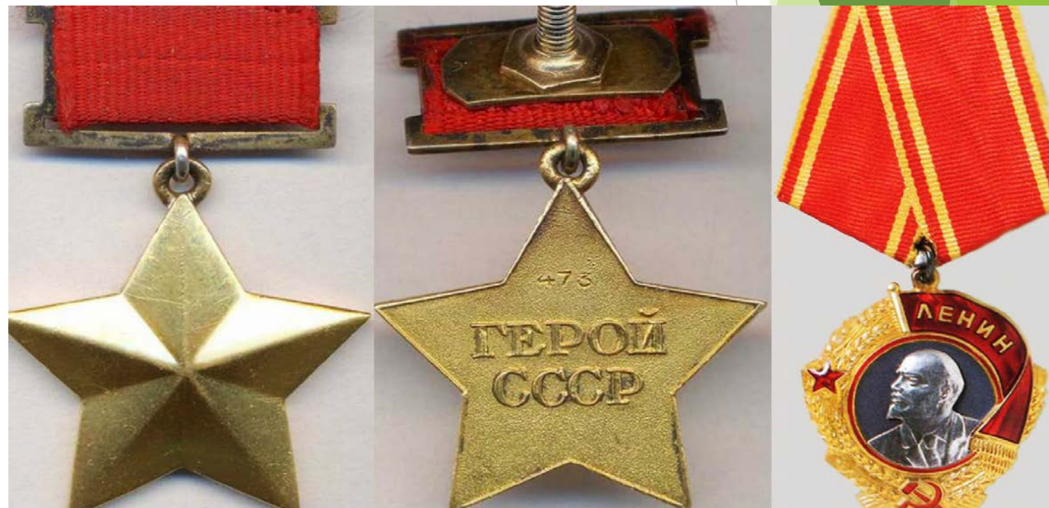
Представление к награде