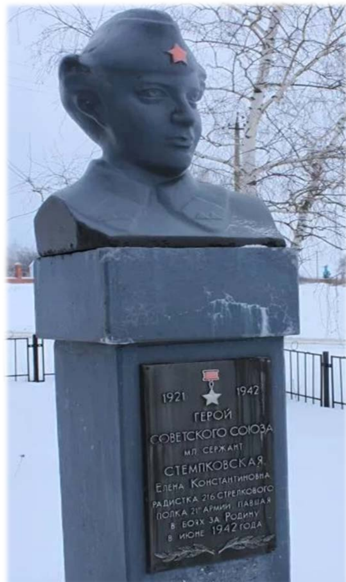
Памятник Елене Стемповской в центральной усадьбе совхоза «Баяут-1»