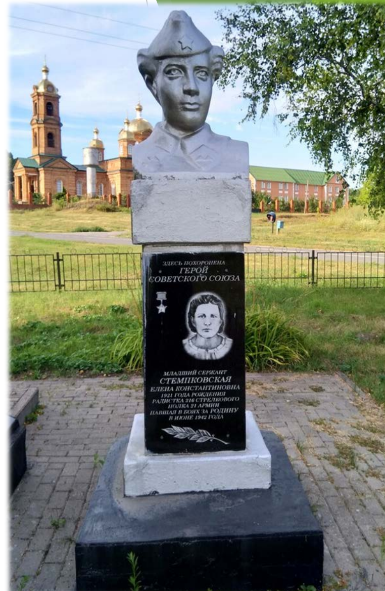
Бюст Елены Стемповской в селе Зимовенька