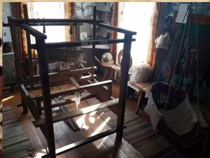
«Дворчанский» ткацкий стан

Образец сложного переплетения нитей, характерный именно для Пинского Полесья.