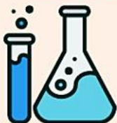
медицинские и жидкие отходы