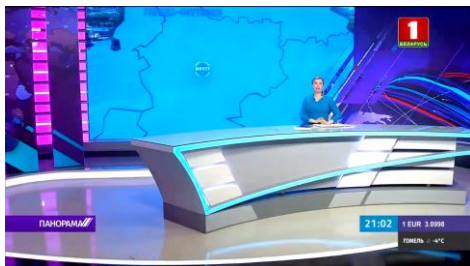
Видео «Застройка городов-спутников в Беларуси: что уже сделано?» (08:20)