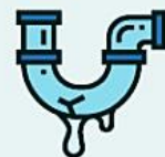
отходы текущего ремонта