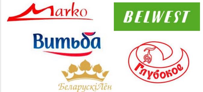
торговые марки Витебской области