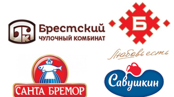
торговые марки Брестской области