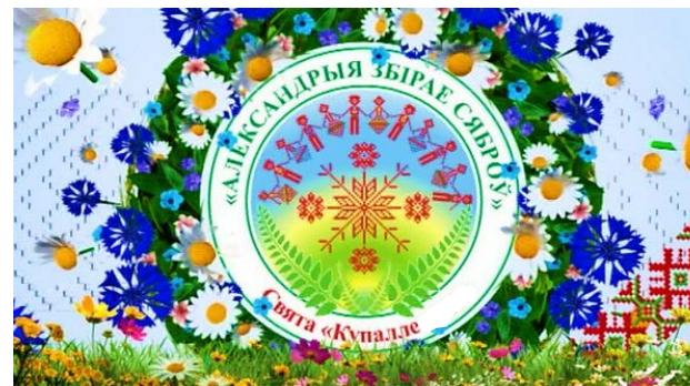
Республиканский праздник "Александрия собирает друзей"