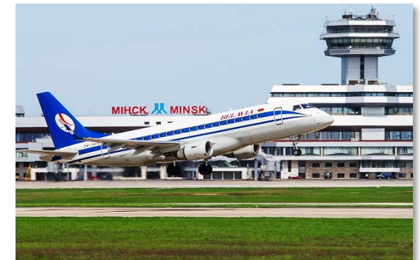
Национальный аэропорт Минск