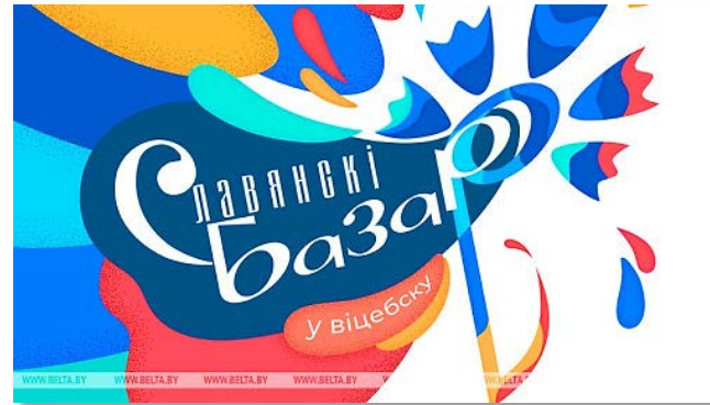
Конкурс «Славянский базар» (г. Витебск)