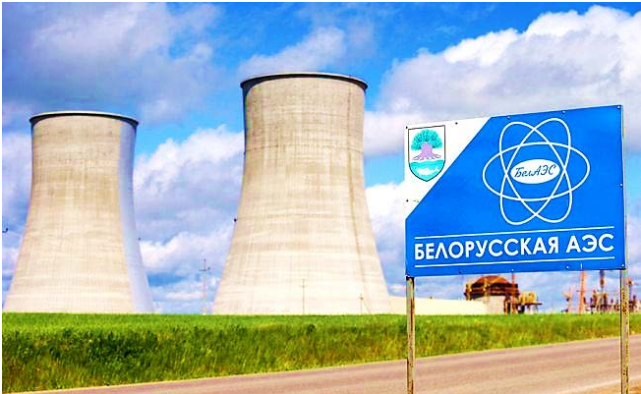
Белорусская АЭС (г. Островец)