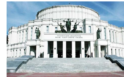
Большой театр оперы и балета