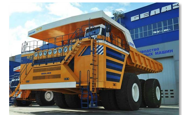
«БелАЗ» (г. Жодино)