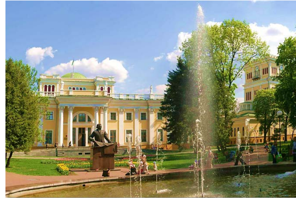
Дворцово-парковый комплекс Румянцевых-Паскевичей