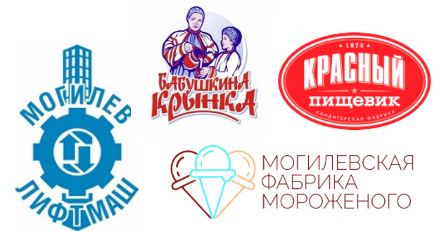
торговые марки Могилевской области