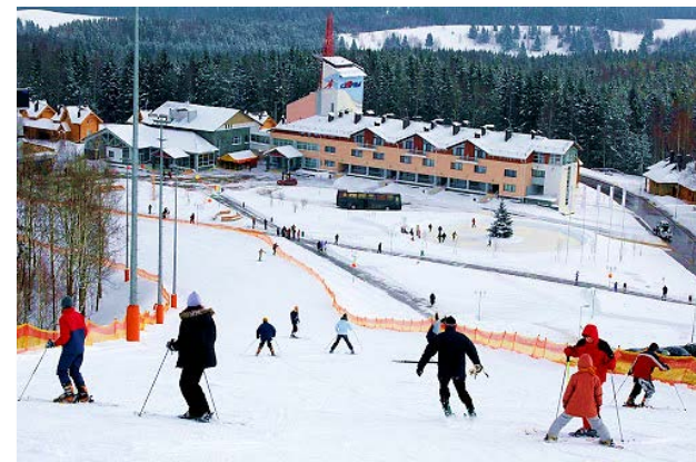
Горнолыжный комплекс «Логойск»