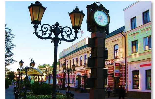
Аллея фонарей (г. Брест)