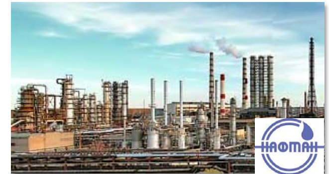
ОАО «Нафтан» (г. Новополоцк)