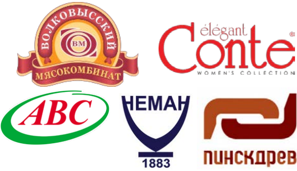
торговые марки Гродненской области