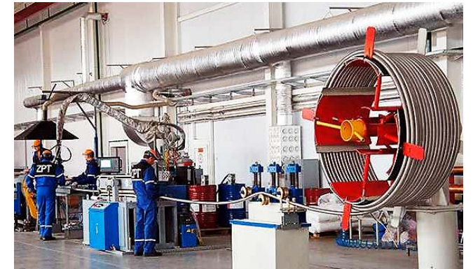
Могилевский завод полимерных труб