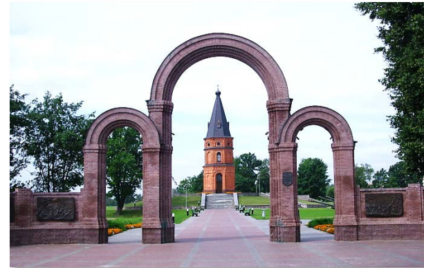
Мемориальный комплекс "Буйничское поле"