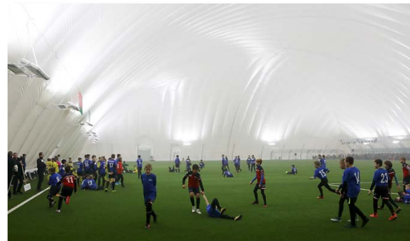
Надувной футбольный манеж (г. Гомель)