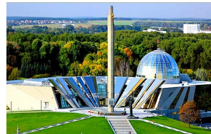
Музей истории Великой Отечественной войны