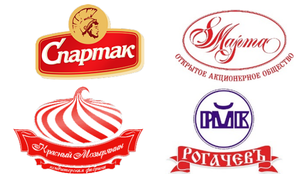
торговые марки Гомельской области