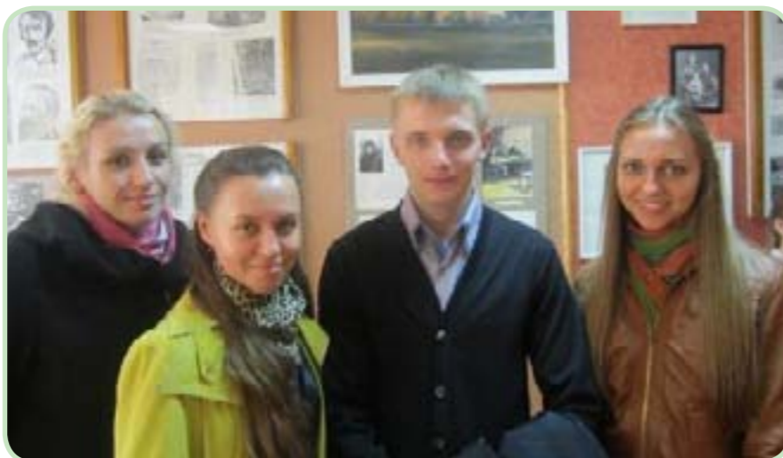
Перспективная молодёжь Полесского государственного университета