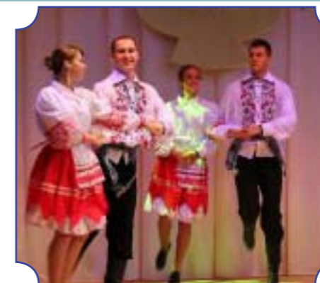
Ансамбль эстрадного танца «Альянс»

ния студенческой молодежи. Студклуб организует культурный досуг, способствует созданию благоприятных условий для развития самостоятельного творчества, художественных и интеллектуальных способностей. Цель – повышение эффективности и качества психолого-педагогического сопровождения учебно-воспитательного процесса в университете, формирования и развития у студентов психологической, духовной культуры. Студенческий клуб выполняет следующие функции: