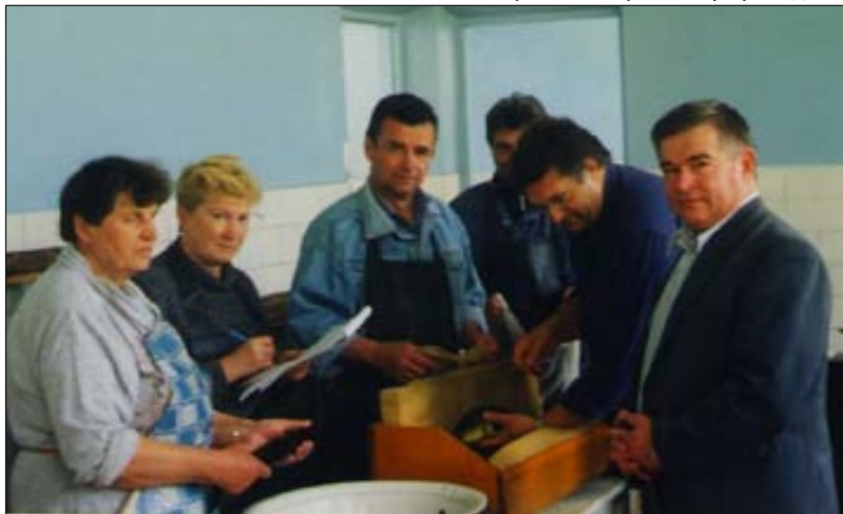
Воспроизводство льна в рыбхозе «Белое»