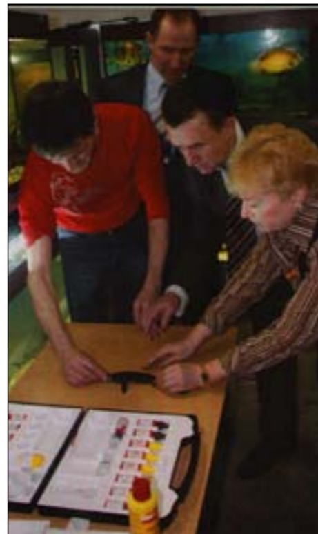
Экспериментальная лаборатория Полесского государственного университета