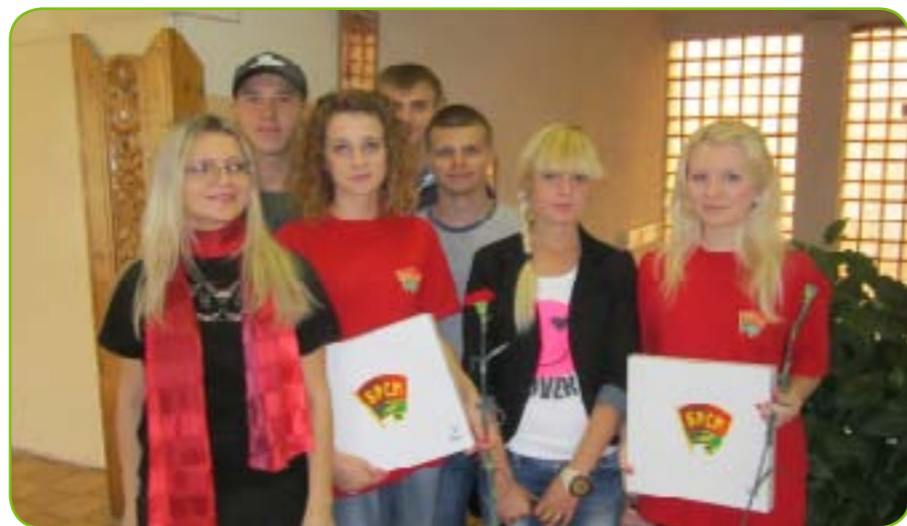
Активисты ПО ОО «БРСМ» поздравляют впервые голосующих