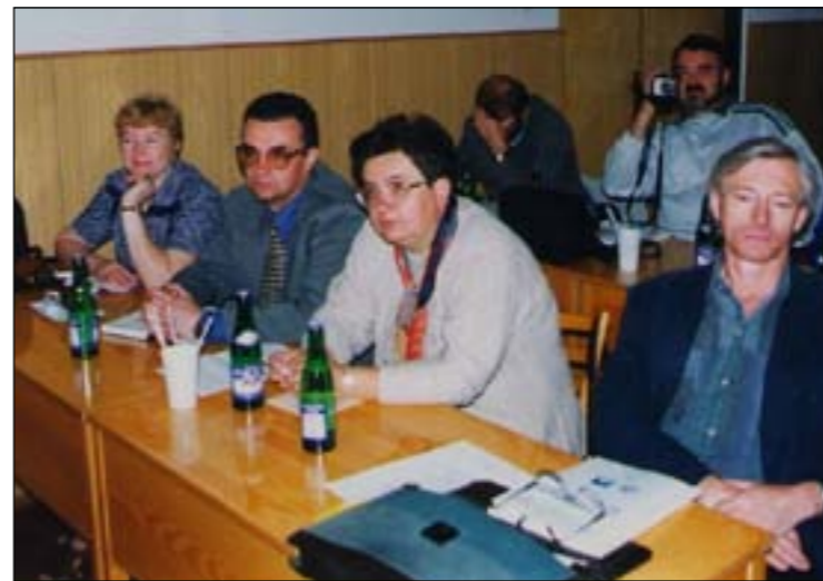
На научной конференции в Чехии