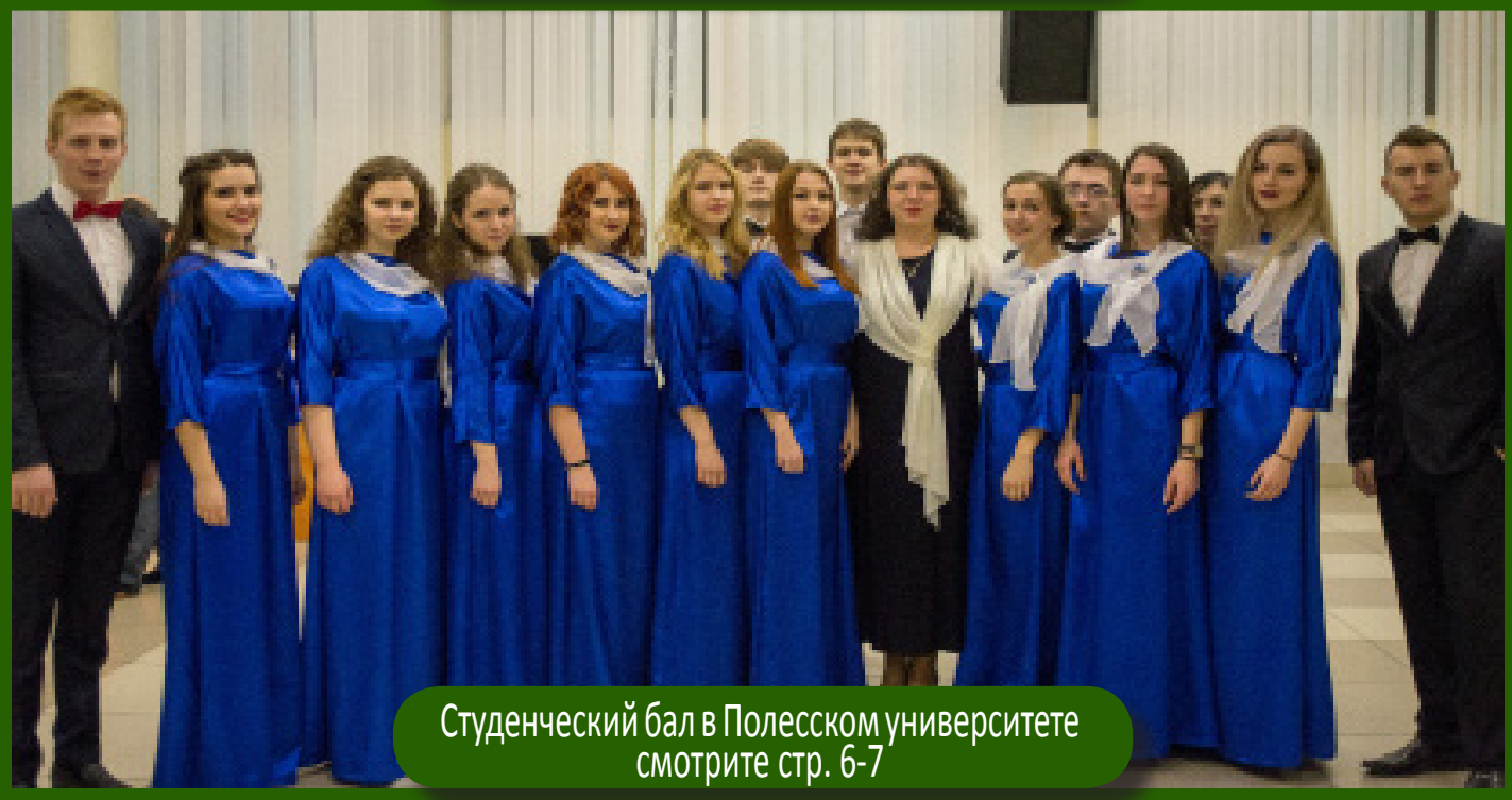
Студенческий бал в Полесском университете смотрите стр. 6-7