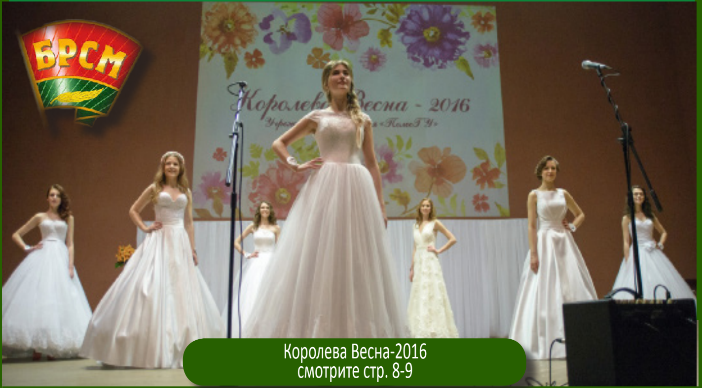
Королева Весна-2016 смотрите стр. 8-9

Газета УО «Полесский государственный университет»