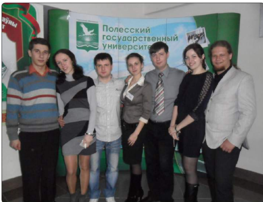
Участники научно-практической конференции