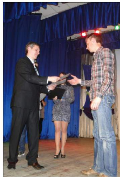
Студенческий совет экономического факультета

Процветай, наш любимый экономический факультет!