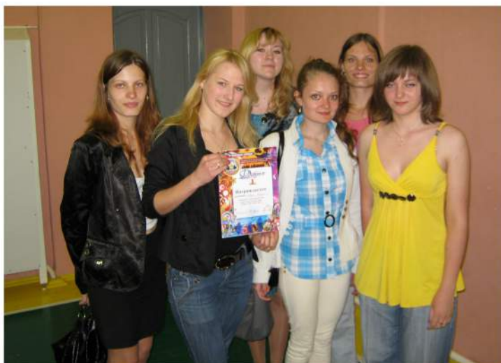
Команда «Друзья Друзя» - победители турнира «Что?Где?Когда?»

За право победителя боролись четыре команды: Элизиум (ЭФ), Друзья Друзя (ФБД и ЭФ), Нитроглицерин (ЭФ) и Николай Бендтнер (ФБД). В итоге – барабанная