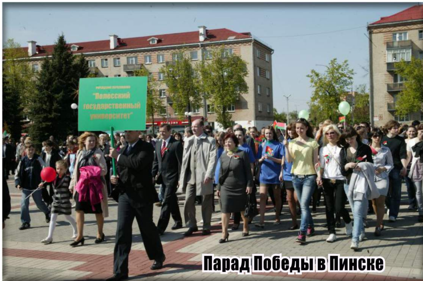
Парад Победы в Пинске

Салют и слава годовщине навеки памятного дня!