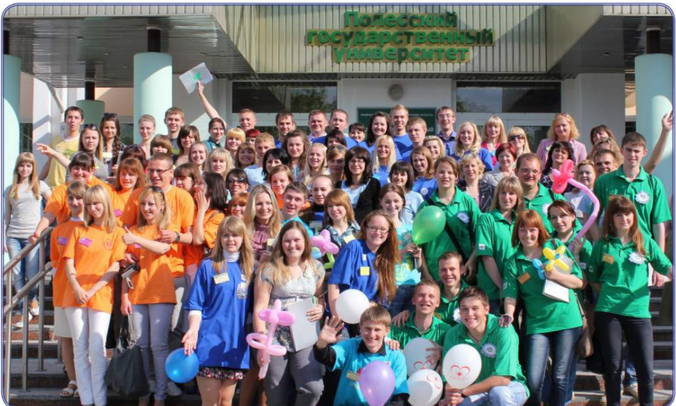
Участники II межвузовского фестиваля «Наш выбор - здоровый образ жизни»

В первый день фестиваля студенты-волонтеры смогли не только рассказать