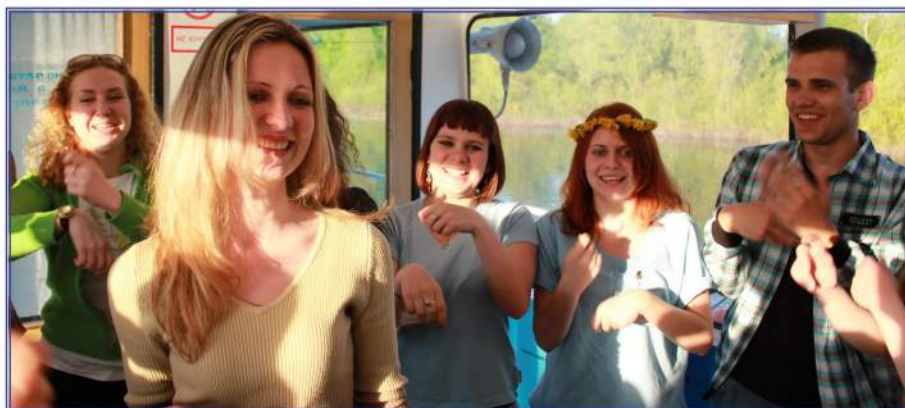
Интерактивные игры на теплоходе