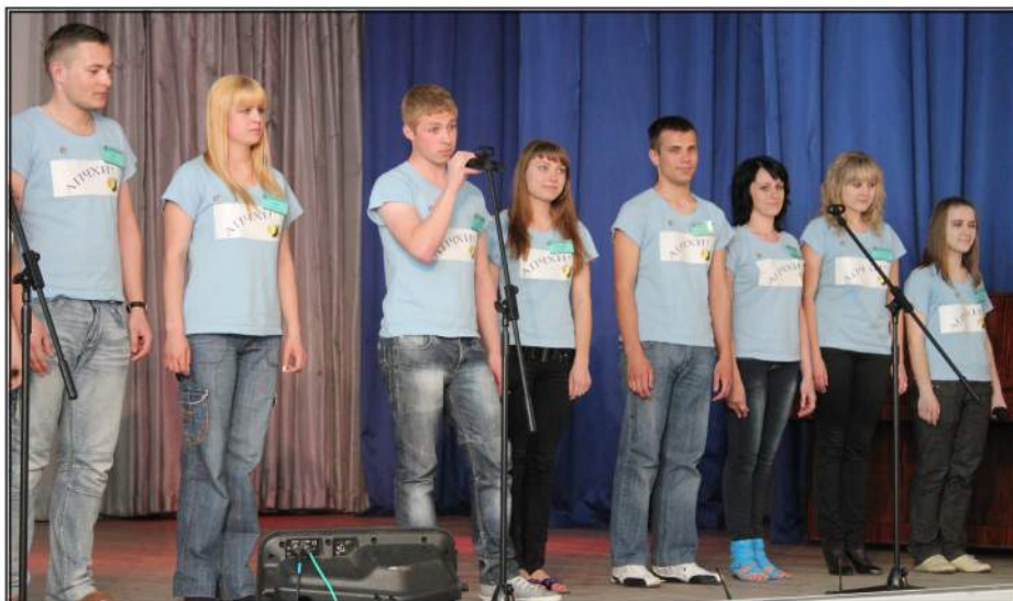
Студенты-волонтеры Полесского государственного университета

о своём опыте и поделиться впечатлениями, но и представить мультимедийные презентации по заданной тематике. А студенты ПолесГУ провели гостям экскурсию по университету. День завершала танцевально-развлекательная программа. Второй день начался с научно-практического семинара, далее прошла демонстрация форм реализации волон-