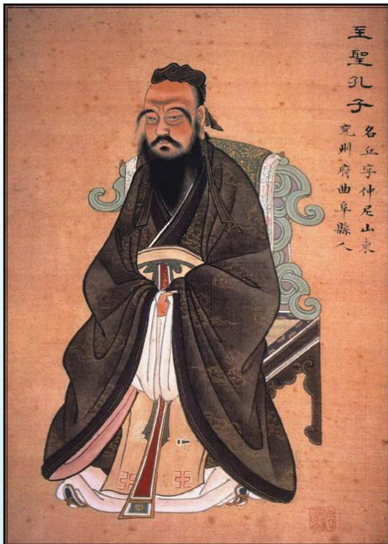
Конфуций, великий китайский мудрец

Побороть дурные привычки легче сегодня, чем завтра.