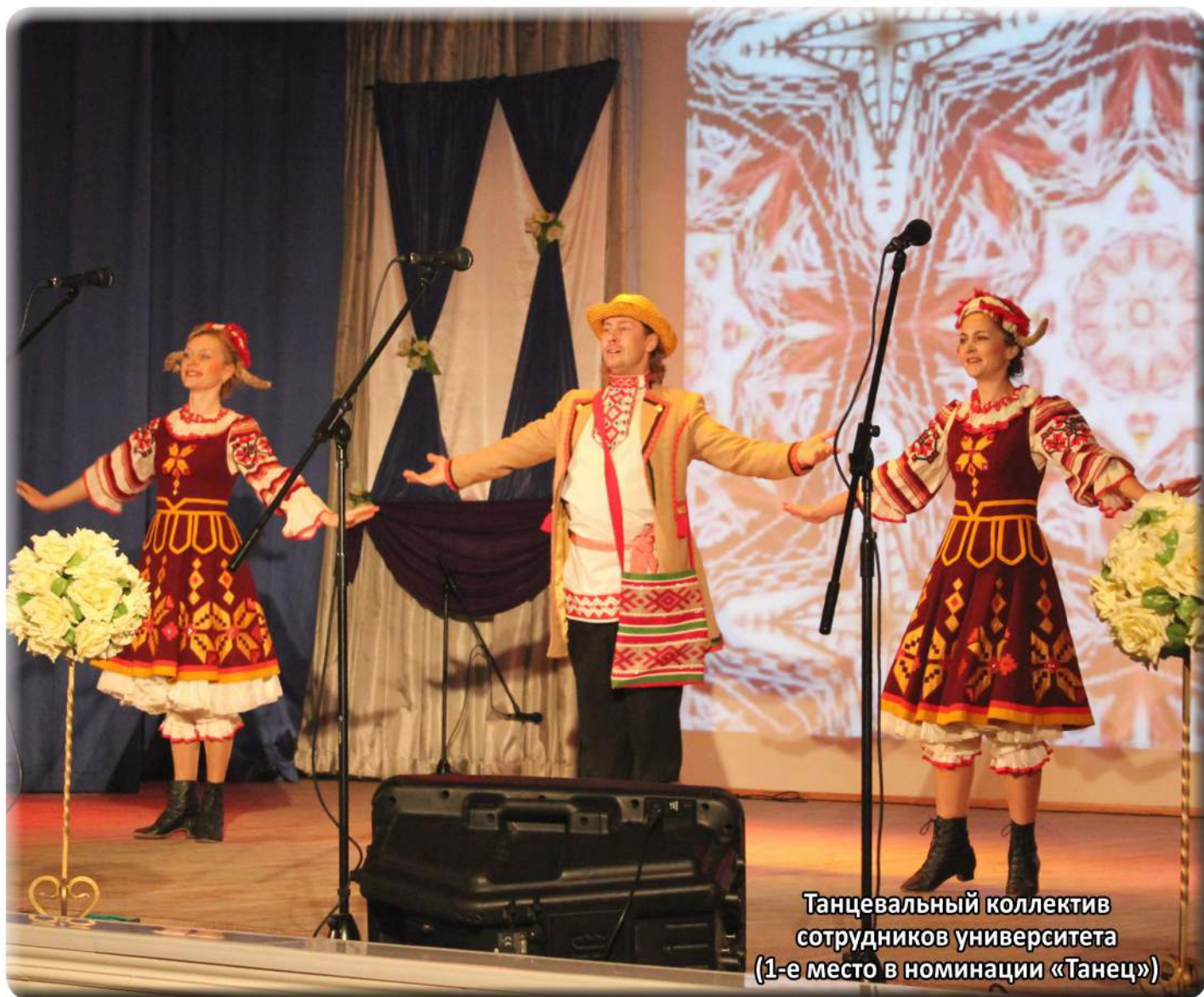
Танцевальный коллектив сотрудников университета (1-е место в номинации «Танец»)

Собираться и делиться творчеством - давняя традиция!