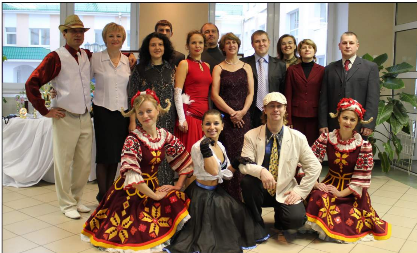
Творческий коллектив Полесского государственного университета

Атмосфера фестиваля, несомненно, праздничная. Атрибуты, дух творчества, яркие номера, коллективизм, дружба, возникающая при подготовке фестиваля – все это оставляет самые приятные впечатления и заставляет с уверенностью утверждать: фестивалю быть!