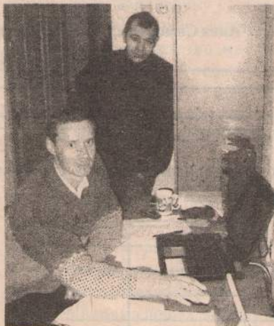
Не секрет, что Полесский государственный университет располагает пре-